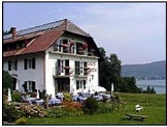
Haus Edith ***