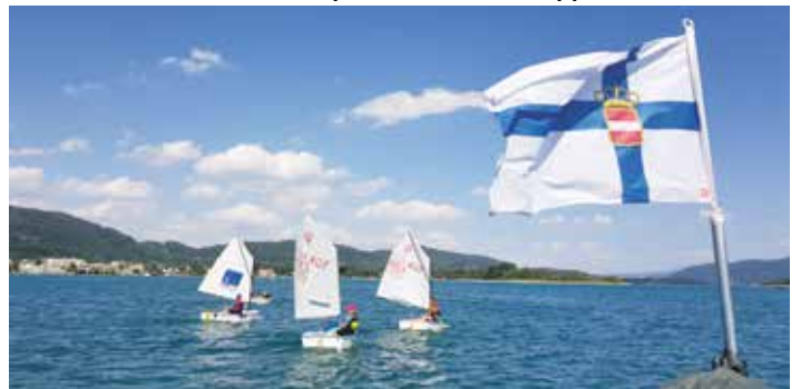
Kinder beim Segeltraining